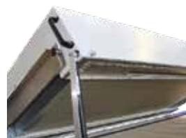
einfache Haubenöffnung durch Gasfeder