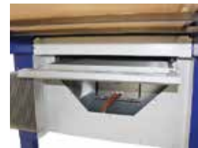
schnell und einfach austauschbarer Luftfilter